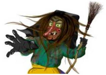
Ried - Hexen